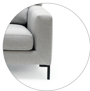
JULIA con pata metálica negra JULIA with black metal legs JULIA avec pieds en métal noir