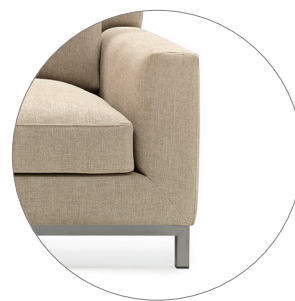
JULIA con zócalo metálico en acero inoxidable JULIA with stainless steel base JULIA avec piètement métallique en acier inoxydable