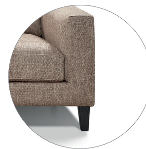
JULIA con pata de madera barnizada JULIA with varnished wood legs JULIA avec pieds en bois verni