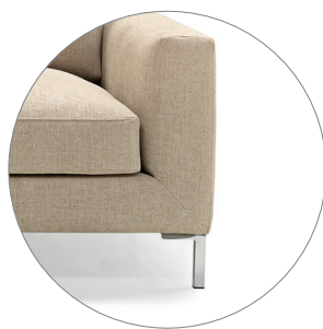
JULIA con pata cromada JULIA with chrome-plated legs JULIA avec pieds chromés