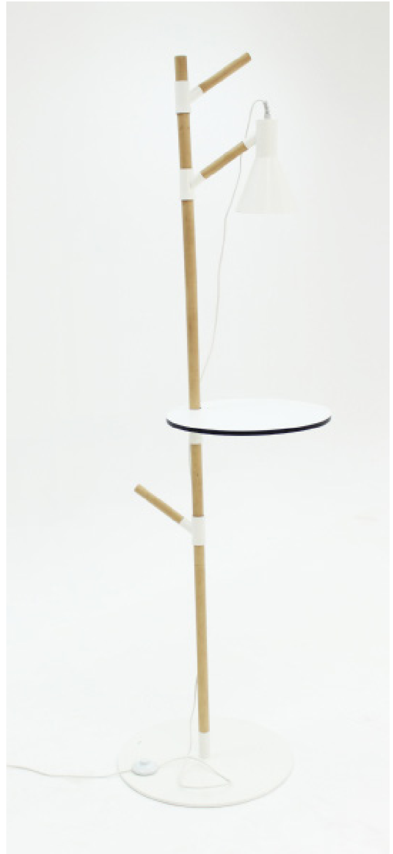
ARBOREUM . DISEÑADO POR JOACHIM KRAFT