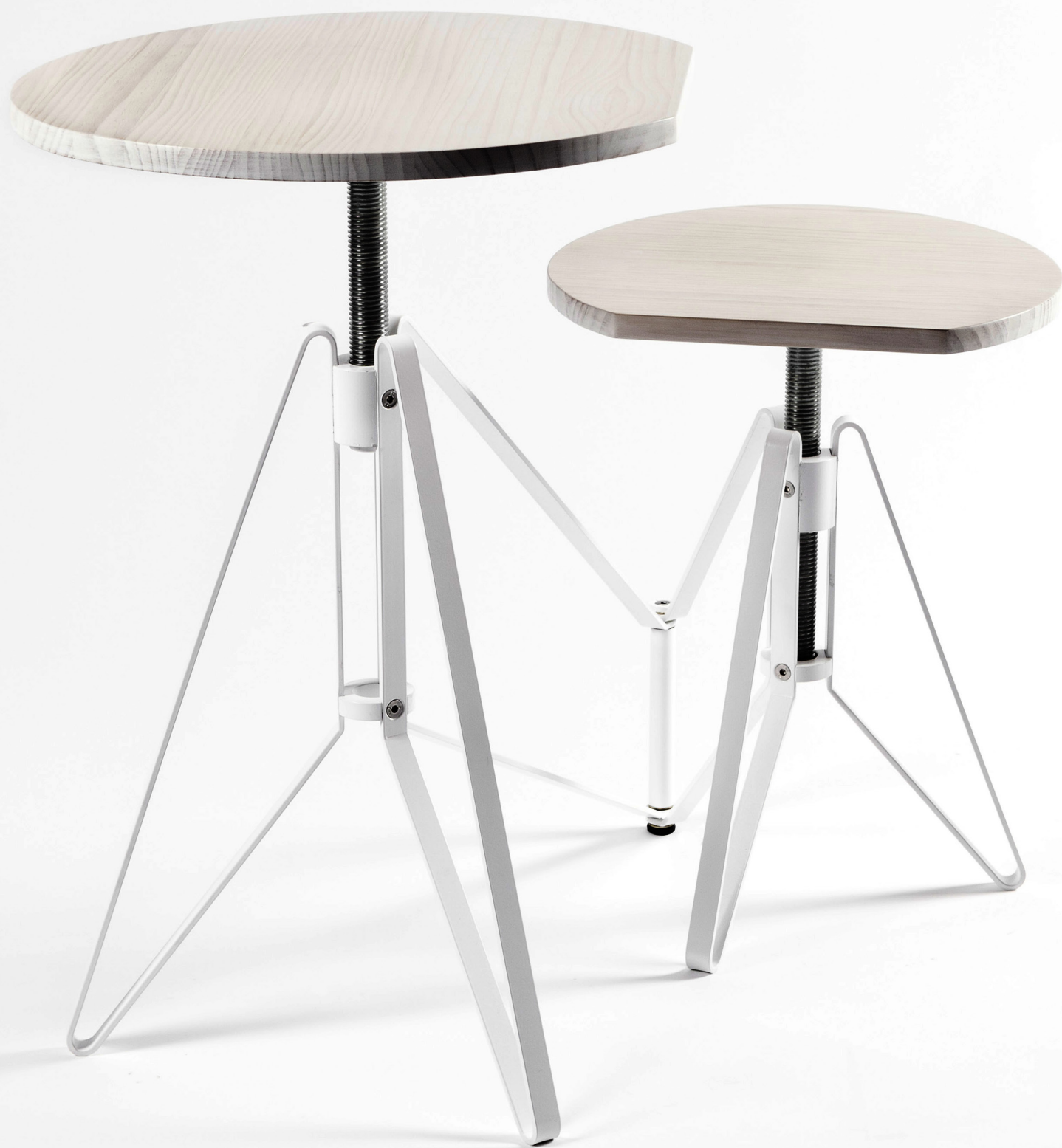
SIAMOO . DISEÑADO POR DAVID CASINO / BERNARDO ANGELINI