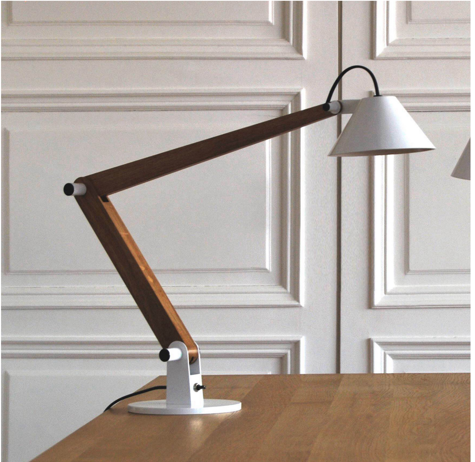
MAMET FLEXO. DISEÑADO POR PABLO CARBALLAL