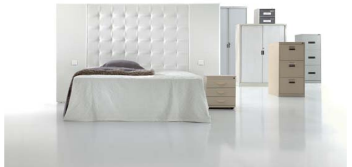
3250 con paneles 5890