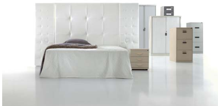
2340 con paneles 3250