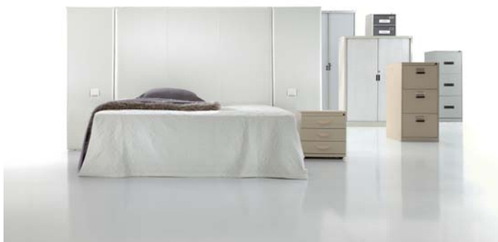
5890 con paneles 5890