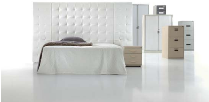
3250 con paneles 3250