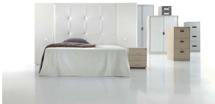
2340 con paneles 5890