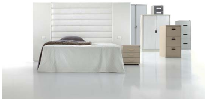
4160 con paneles 5890