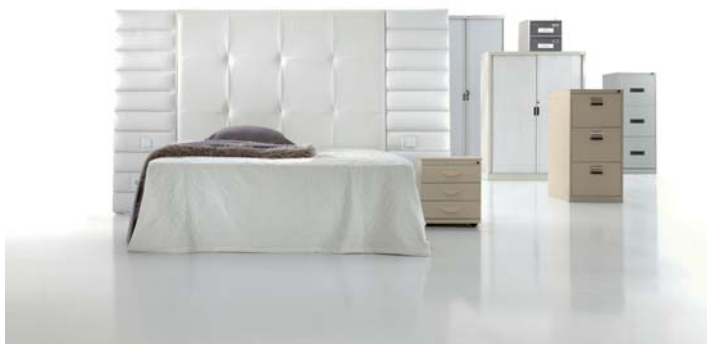
2340 con paneles 4160