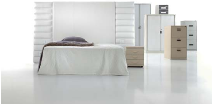
5890 con paneles 4160