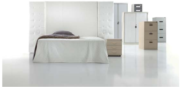
5890 con paneles 3250