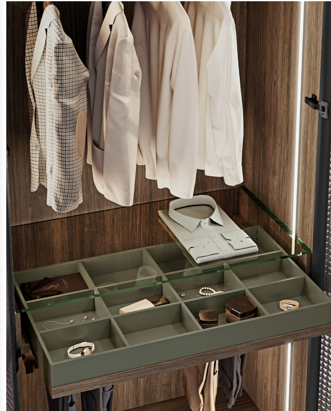
Estante extraíble con clasificador Thermo – Hoja Mate.