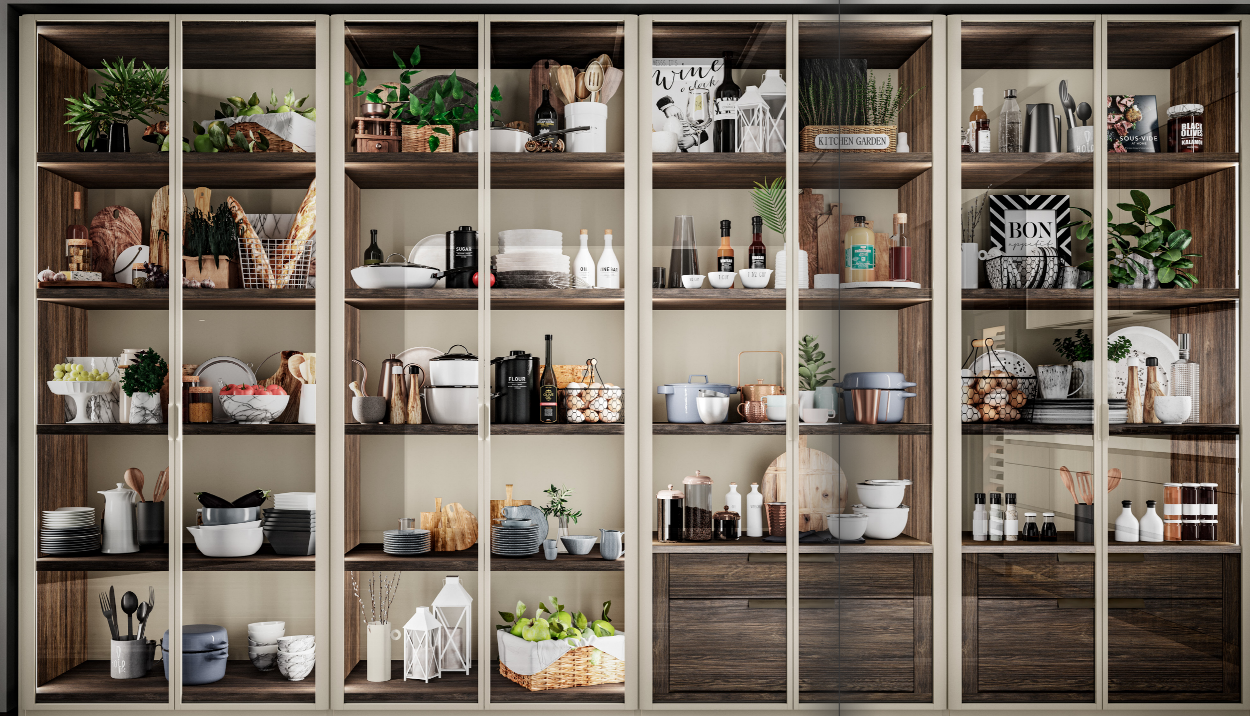
Puertas GRIP Aluminio Piedra – Cristal Fumé Marrón.