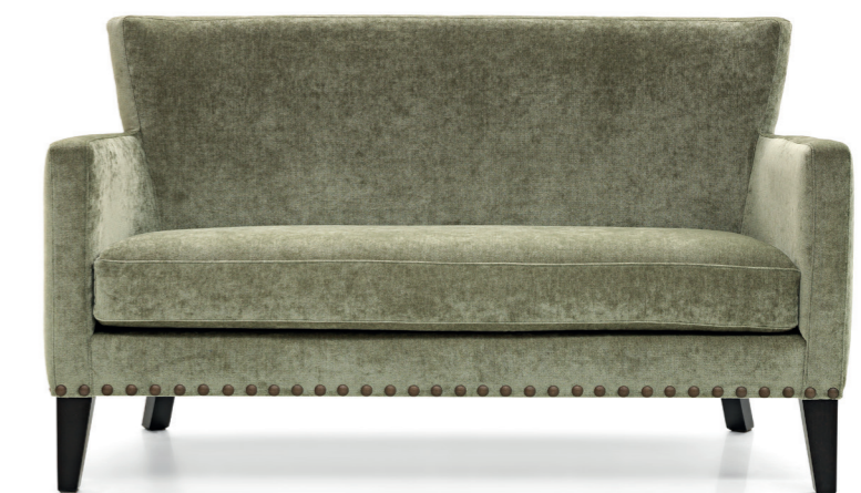
▲ CARO 2P estándar con pestaña y opción con tachuelas. CARO 2P: standard without piping; studs optional. CARO 2P standard avec passepoil et option avec cloutage.