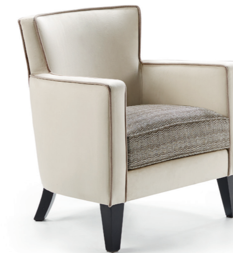
▲ CARO 1P opción con vivo. CARO 1P option with piping. CARO 1P option avec passepoil.

Structure en bois massif avec suspension de sangles élastiques. Coussin d'assise en mousse de polyuréthane densité 35 kg dureté moyenne. Pieds en bois verni. Finition standard sans passepoil et sans cloutage. Option finition avec passepoil. Option finition avec cloutage.