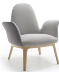
OP. (asiento integrado)