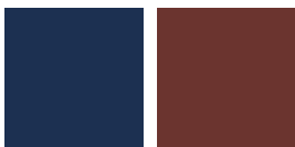
Fresno lacado azul oscuro Dark Blue Lacquered Ash Ral 5013