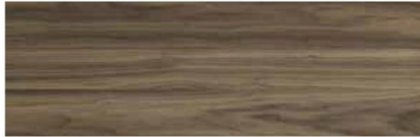
American walnut / Nogal Americano / Noyer Américain