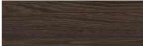
Smoky oak / Roble Fumé / Chêne Fumé