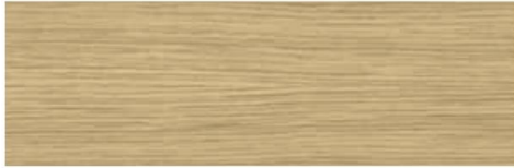
European oak / Roble europeo / Chêne Européen