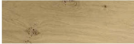
Leopard oak / Roble Leopard / Chêne Leopard