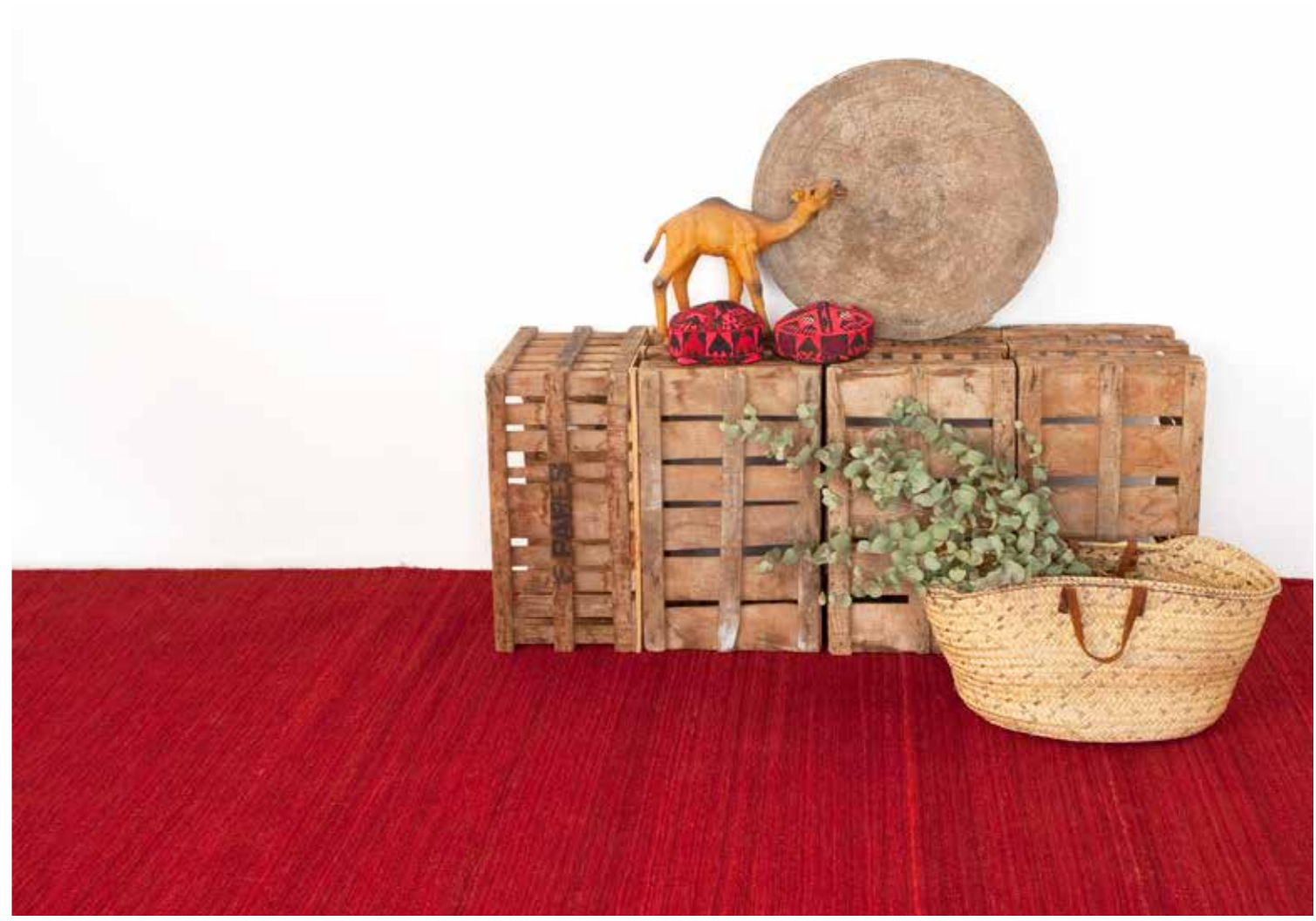
Grana / Deep red