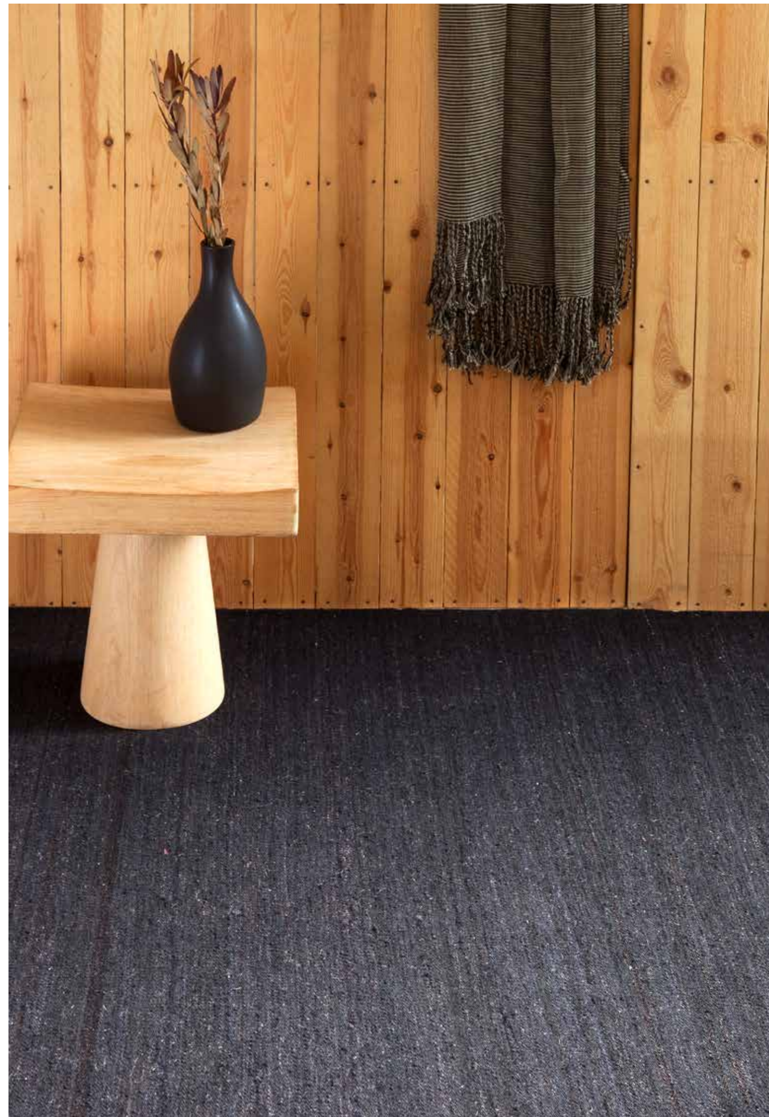
Negro / Black