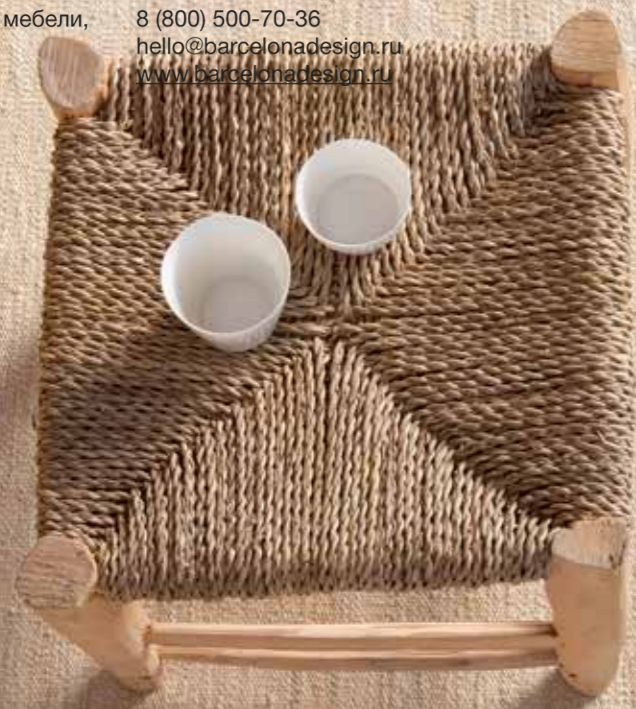
Natural / Natural