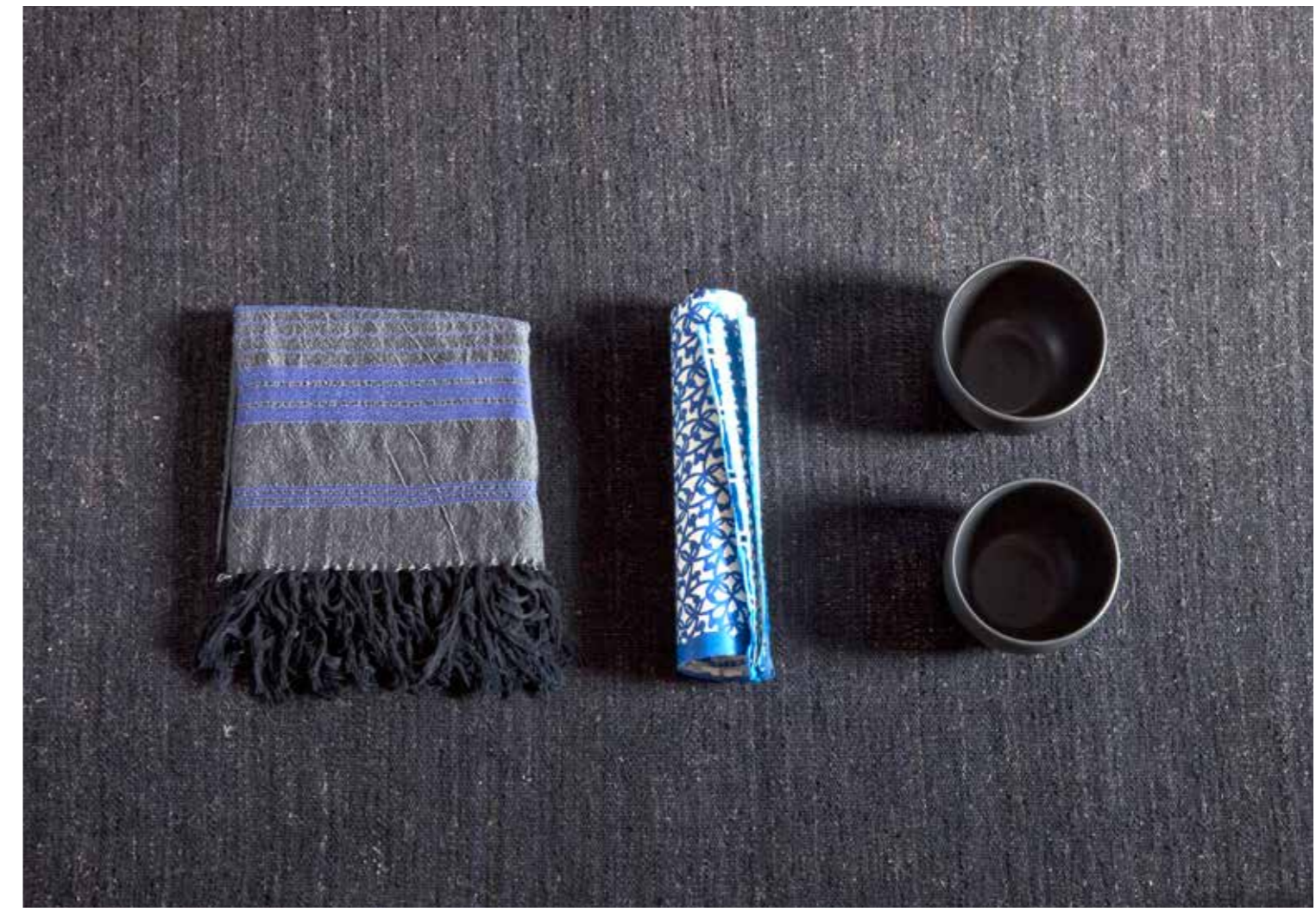
Negro / Black