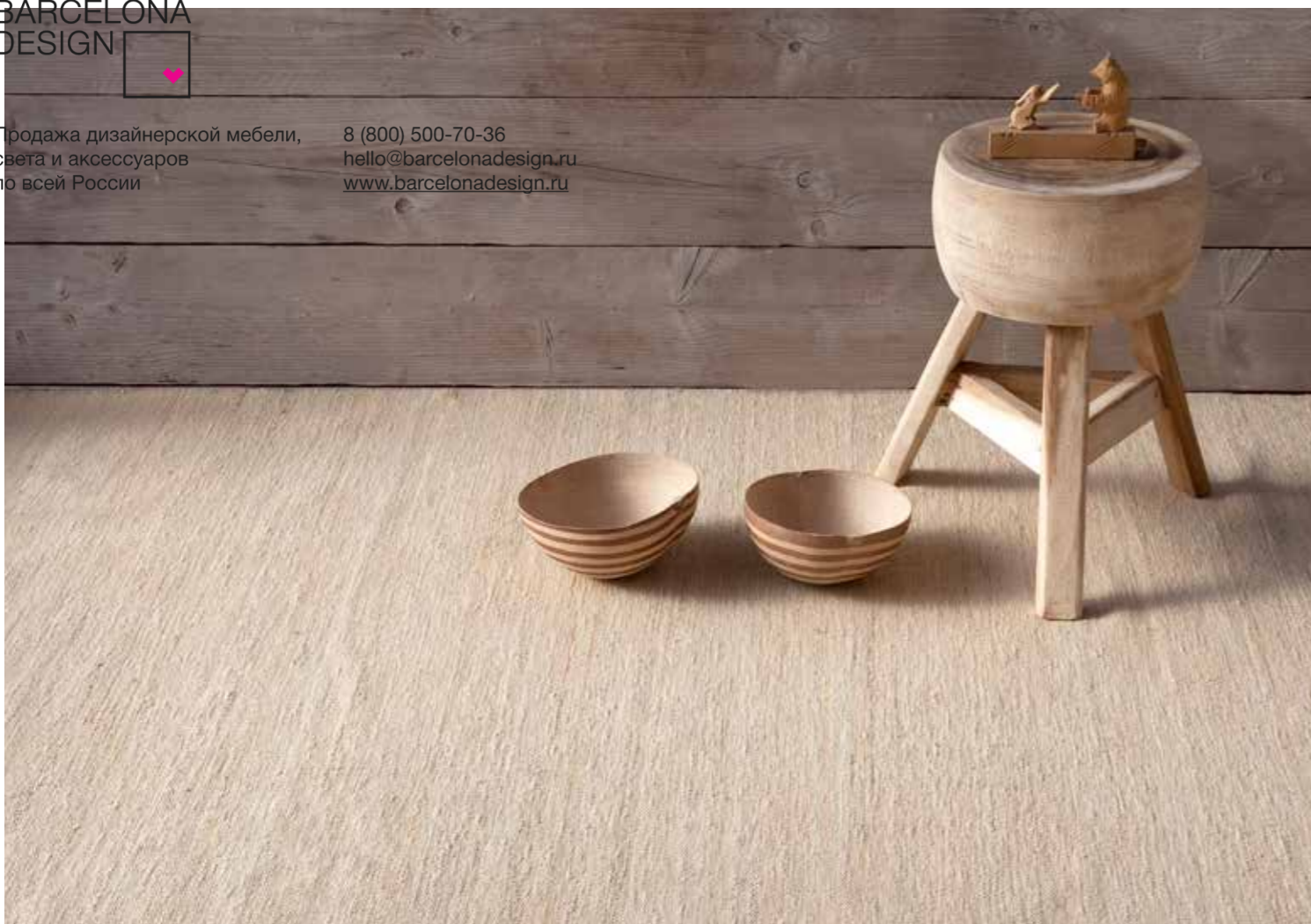
Natural / Natural