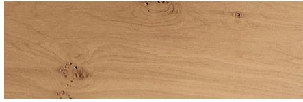
Leopard oak / Roble Leopard / Chêne Leopard