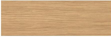
European oak / Roble europeo / Chêne Européen