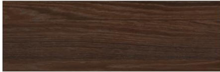
Smoky oak / Roble Fumé / Chêne Fumé