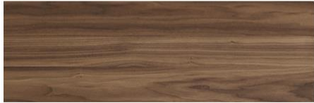
American walnut / Nogal Americano / Noyer Américain