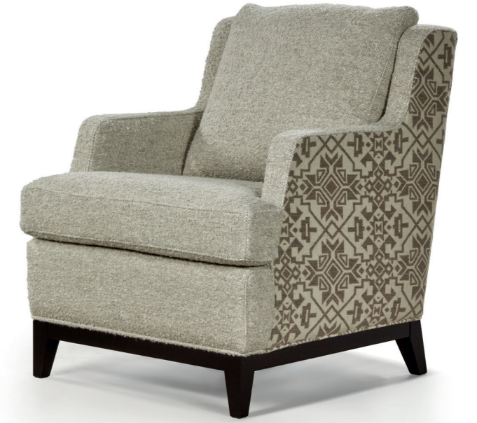
▲ ORLY AIP