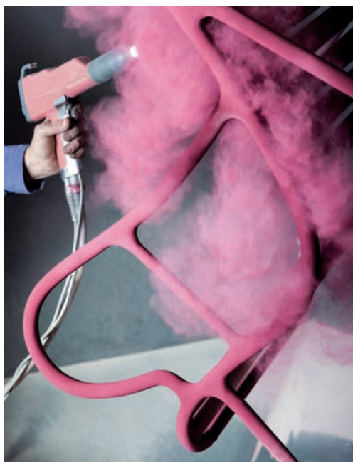
Axalta Coating System

Gardenias est une collection de Mobilier pour le jardin. Elle n'est pas limitative, comme d'autres collections peuvent l'être. La finesse, la beauté et l'histoire sont présentes dans ce design. Elle a aussi la volonté d'offrir un programme vaste et varié, polyvalent et ouvert, offrant de la place pour des vases-sculptures et des pots de fleurs en terracota d'une étonnante finesse, des fauteuils avec ou sans pergola et canapés.